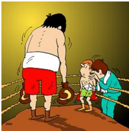
Kresba: Jozef Jurko

Dánsky príklad poukazuje na dôležitosť špecifickej historickej trajektórie vývoja právneho štátu, inštitúcií a verejnej správy v úspešných krajinách a snaží sa identifikovať kľúčové faktory tohto úspechu.